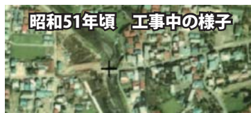
昭和51年頃 工事中の様子

ただ、この影響で特に西岸の川沿いの道路は狭く変則的な形状になってしまい、令和2年の現在も接触事故が起きやすい、怖いゾーンになっていることから、早めの改善が希望されます。