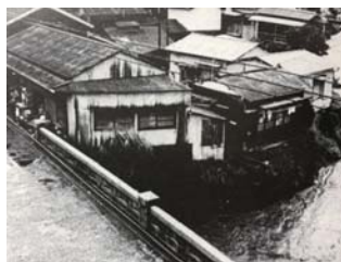
昭和54年頃 工事完了後